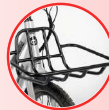
PANIER AVANT ALU