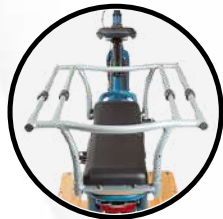
BARRE PROTECTION ENFANT