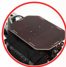
PLATEFORME CHARGEMENT NUE