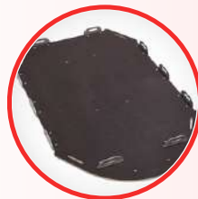
PLATEFORME CHARGEMENT PRO