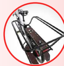
BARRE PROTECTION ENFANT