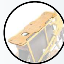
PLANCHE POUR ASSISE