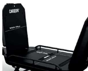
Plateau aux nombreuses options de fixation