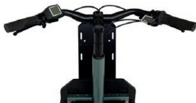
Double câble de direction