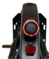
Système d'éclairage design et puissant