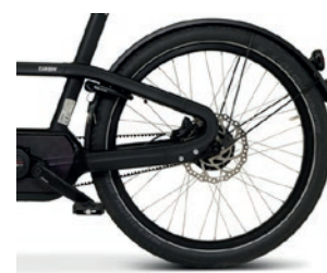
Freins à disque hydrauliques 4 pistons ultra-puissants