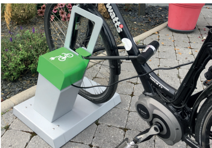
ALTAO Parco VAE - borne de recharge vélo électrique