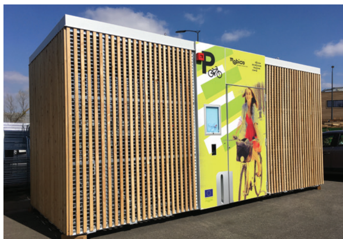
Abri Cigogne - consigne collective 20-40-60... places