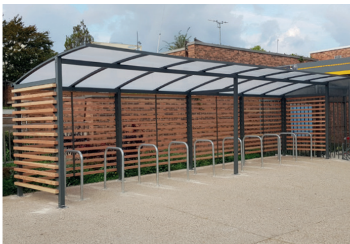
ALTAO Curve - abri ouvert pour stationnement vélo