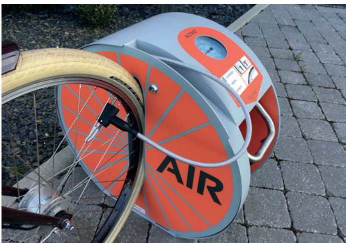
ALTAO Pump - station de gonflage vélo à pied