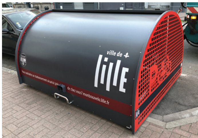
ALTAO Cover - consigne collective 5 places