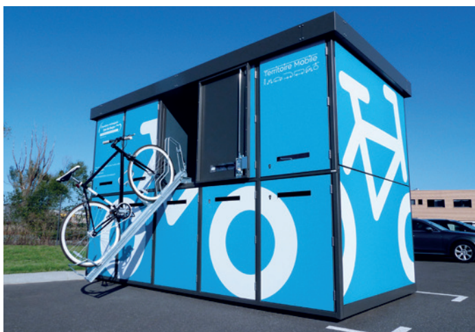
ALTAO Duplex - consigne individuelle 5 places