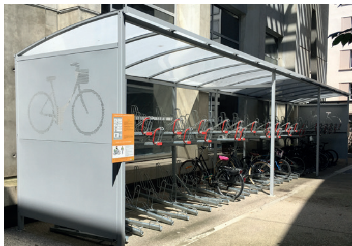
ALTAO Curve Optima - abri pour stationnement vélo en double-étage

➤ Contactez-nous pour connaître les nombreux équipements, accessoires et options disponibles :