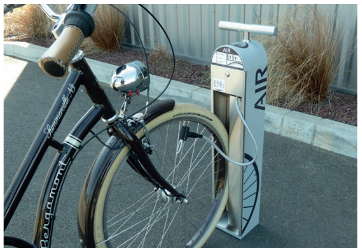
ALTAO T'Pump - station de gonflage manuelle