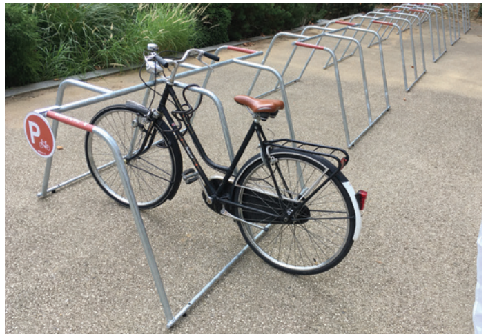
ALTAO Mobile - rack de stationnement temporaire