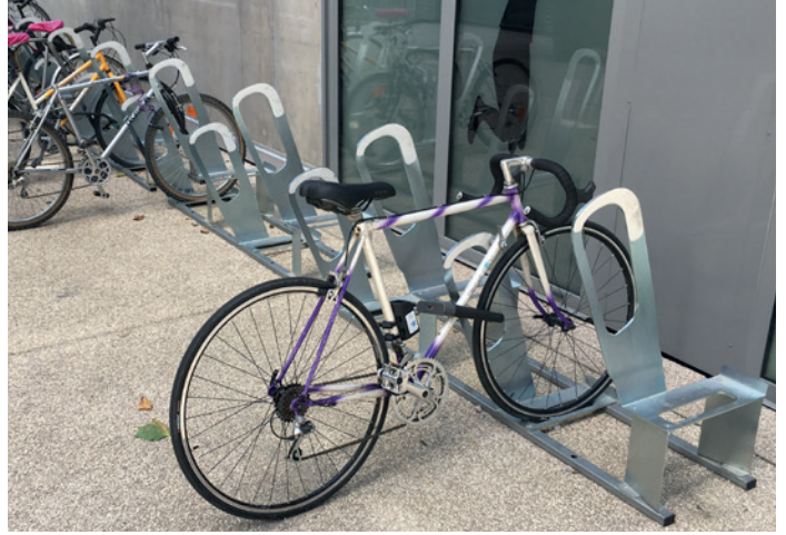
ALTAO Parco - rack de stationnement vélo