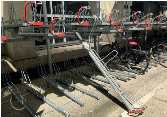
Optima V10 - rack de stationnement double-étage