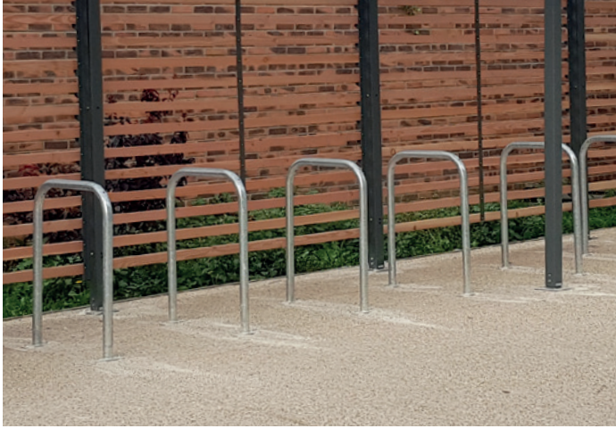
Arceau U renversé - stationnement vélo