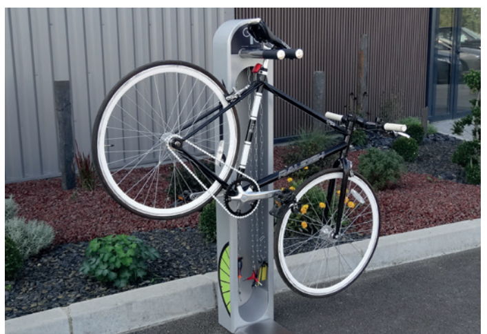
ALTAO Fix - totem de réparation vélo en libre-service