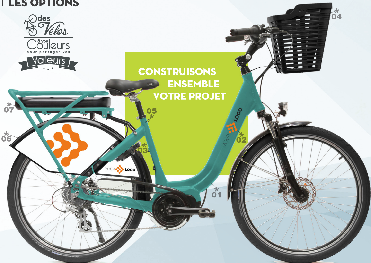
01/02 Peinture et marquage Personnalisés