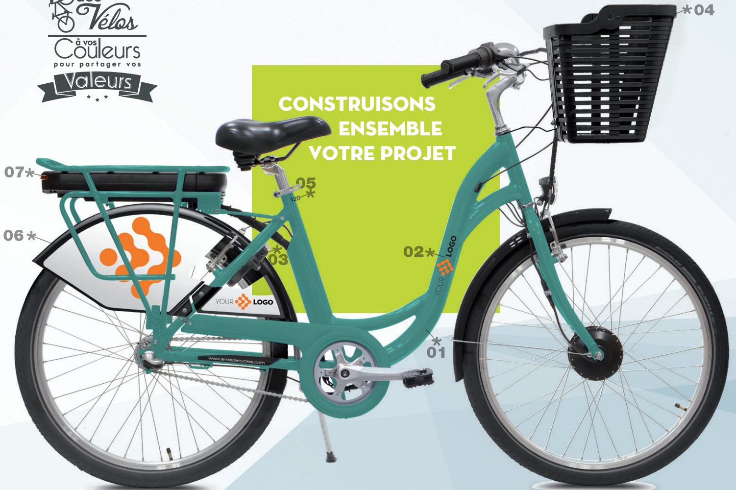
01/02 Peinture et marquage Personnalisés